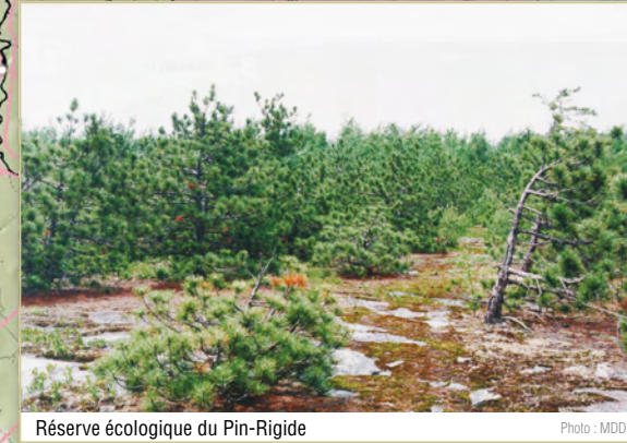
Réserve écologique du Pin-Rigide