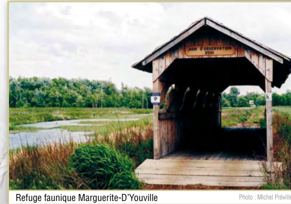
Refuge faunique Marguerite-D'Youville