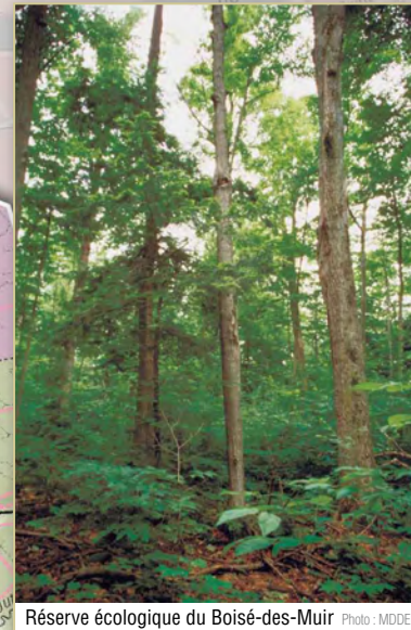
Réserve écologique du Bois-des-Muir