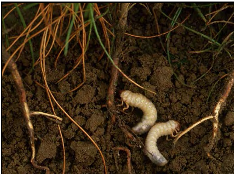
Figure 8. Les vers blancs du hanneton, des insectes rhizophages

Les racines servent d'hôtes à plusieurs insectes se nourrissant sous terre. Bon nombre d'entre eux sont utiles. Par contre, les problèmes surviennent lorsque ces insectes s'installent en nombre excessif et provoquent un stress aux arbres. Les rhizophages causent souvent le plus de dommages dans les pépinières, lorsqu'ils s'attaquent à de jeunes arbres aux tissus tendres et vulnérables. Le ver blanc du hanneton et certaines espèces de charançons sont des rhizophages.