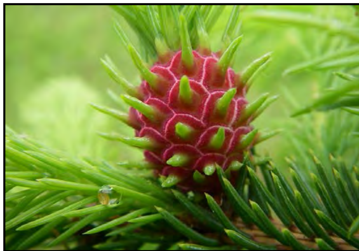
Figure 7. Galles du puceron à galle conique de l'épinette

De nombreuses espèces d'insectes provoquent l'apparition de galles. Dans les forêts, les insectes gallicoles sont nuisibles aux épinettes. Leur cycle de vie s'échelonne sur deux ans et se déroule habituellement sur six générations. Les larves creusent dans les pousses d'arbres pour former des chambres. La cécidomyie gallicole de l'épinette et le puceron à galle allongée de l'épinette sont des insectes gallicoles.