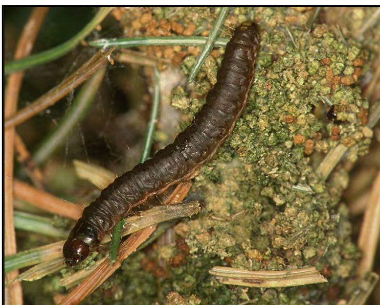
Figure 5. Les pyrales des cônes, des insectes des cônes et des graines

Le chalcis des graines et la pyrale des cônes font partie de cette catégorie d'insectes. Les méthodes de lutte sont axées sur l'application d'insecticides pouvant pénétrer dans les cônes et les graines. Ces insecticides sont souvent appliqués à l'aide de pulvérisateurs à jet.