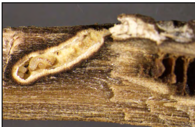
Figure 3. Les scolytes, des insectes ravageurs de tissus ligneux

La sensibilité des arbres à certains insectes xylophages dépend en grande partie de l'épaisseur de l'écorce, laquelle est essentiellement tributaire de l'âge de l'arbre. En prévoyant la récolte de certaines essences avant que le peuplement ait atteint le stade de la maturité, on peut diminuer grandement les risques d'une attaque de ces insectes. On peut également réduire certaines infestations en plantant un mélange d'essences à des fins de reboisement, si les conditions économiques et écologiques le permettent. Certaines essences d'arbres abattus par le vent attirent également ces insectes, lesquels se propagent ensuite aux arbres environnants.