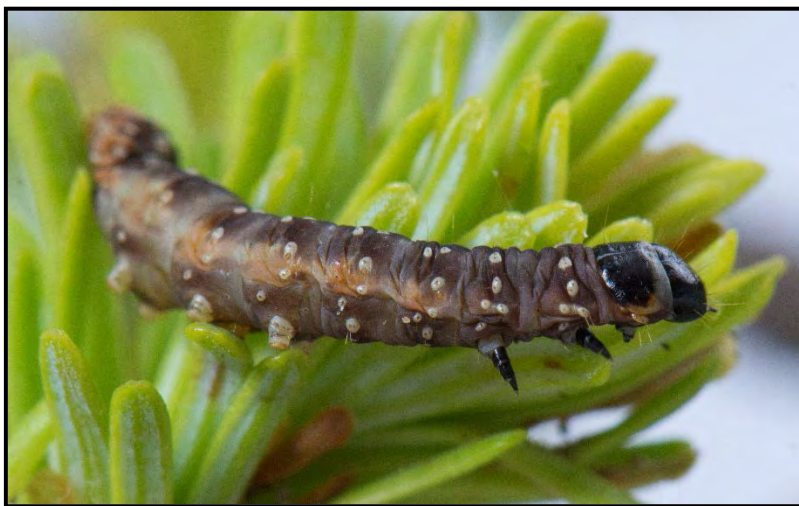
Figure 4. Les tordeuses des bourgeons d'épinette, des insectes défoliateurs

Il est important de noter que pour la protection des forêts publiques du Québec contre la tordeuse des bourgeons de l'épinette, l'application d'insecticide biologique, le Btk , est effectuée par voie aérienne. Ce type d'application ne cadre pas dans les activités visées par le présent guide.