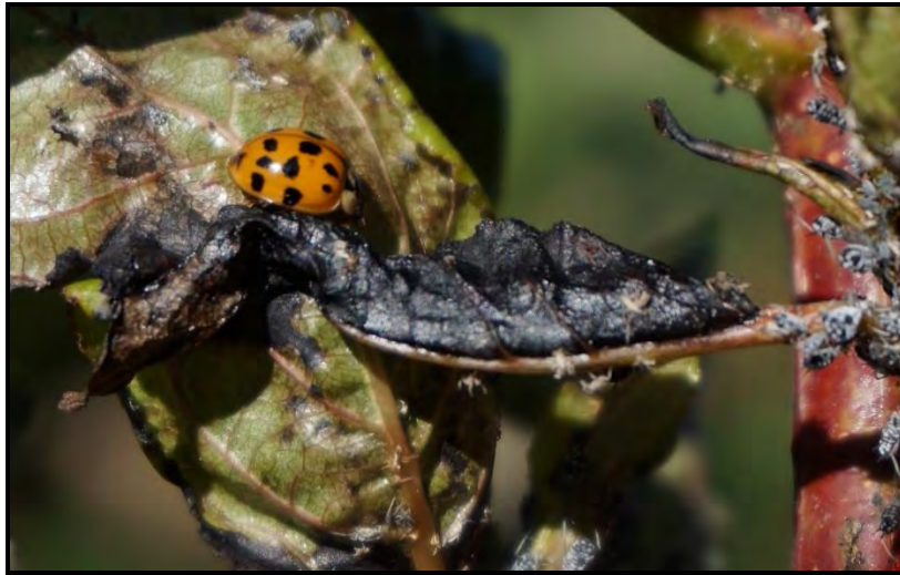
Figure 6. Les pucerons, des insectes suceurs

Les attaques de la tige ou des branches peuvent provoquer l'apparition de galles ou de difformités, ou encore une réduction de la croissance. Le cycle de vie de la majorité de ces espèces est complexe puisqu'ils ont besoin d'hôtes intermédiaires pour compléter leur cycle de vie. Les épidémies sont en général sporadiques et de courte durée. La lutte contre ces insectes est très difficile.