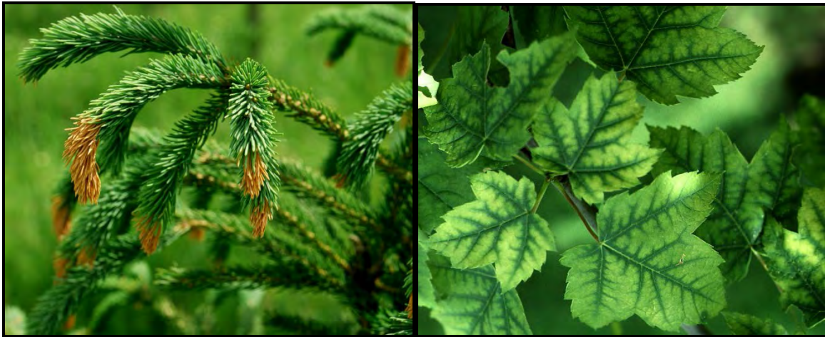
Figure 9. Exemples de symptômes de maladies non parasitaires provoqués par un gel printanier (à gauche); une carence minérale (à droite)

Ces maladies sont non contagieuses et ne se propagent pas comme les maladies parasitaires.