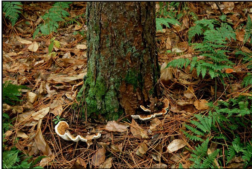
Figure 10. Maladie du rond provoquée par un champignon

Si les conditions environnementales sont favorables, les spores fongiques germent. Après la germination, les spores fongiques sont vulnérables aux fongicides. L'infection commence lorsque le champignon pénètre dans les tissus de la plante. À l'intérieur de la plante, le champignon est protégé et devient difficile à détruire. Un fongicide systémique peut enrayer la maladie s'il est appliqué avant que l'infection ne s'aggrave trop.